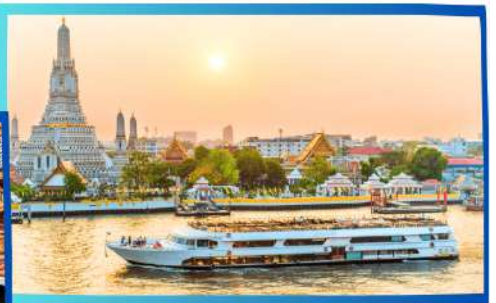
DU THUYỀN BANGKOK