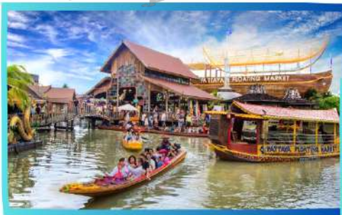
CHỢ NỔI 4 MIỀN