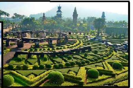
VƯỜN LAN NONGNOOCH