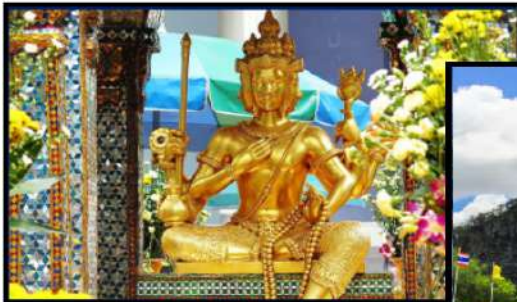
TỬ ĐIỆN THẦN