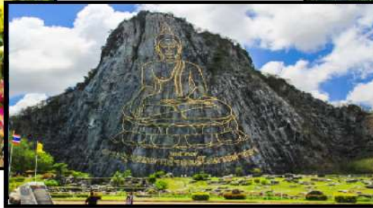
TRẦN BẢO PHẬT SƠN