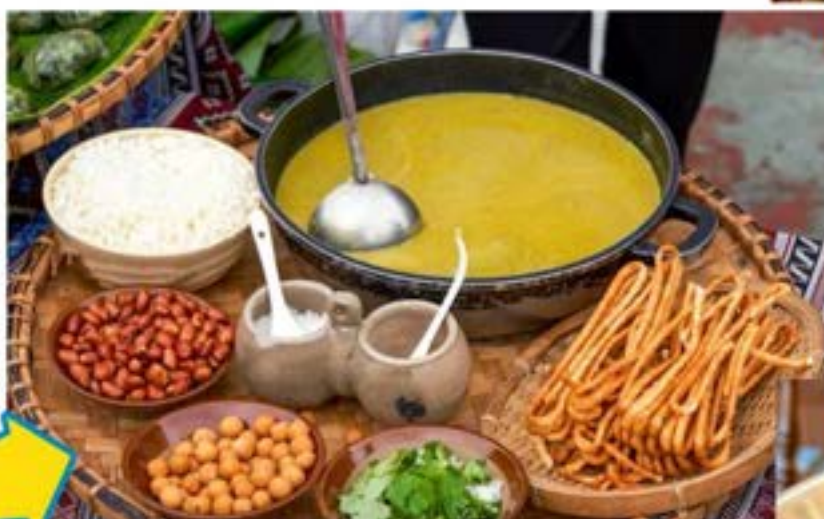
YẾN TRÀ DẦU QUẢNG TÂY