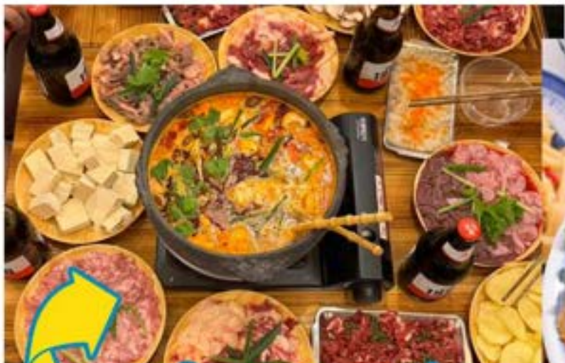
LẨU ĐẶC SẮC