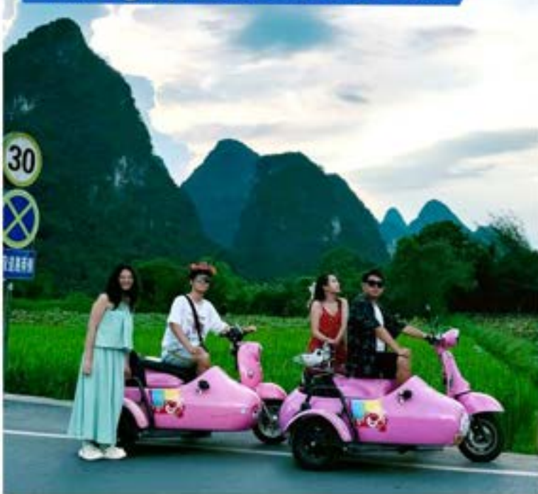
Trải nghiệm xe mô tô ba bánh