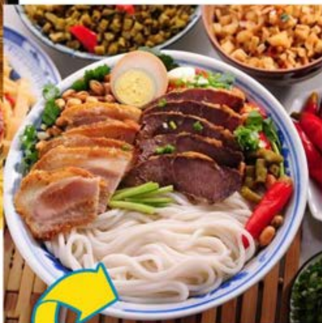
BÚN LỐ QUẾ LÂM