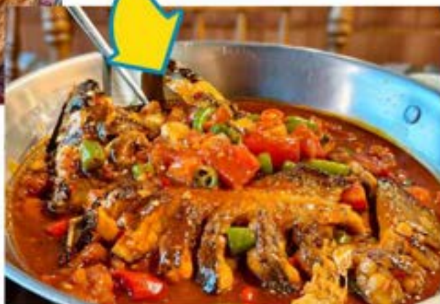
CÁ HẤP BIA